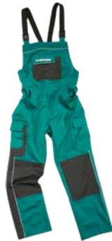
Latzhose grün Komfortabel und stark Salopette verte Confortable et solide Dungarees green Comfortable and strong Größen | Tailles | Sizes: 42 - 64