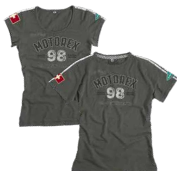
Retro T-Shirt Damen und Herren T-shirt rétro femmes et hommes Retro T-shirt men and women