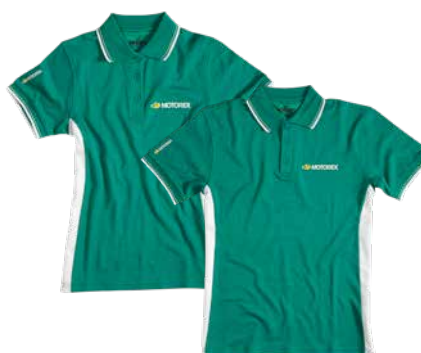
Poloshirt grün Damen und Herren Poloshirt vert femmes et hommes Poloshirt green women and men

Besuchen Sie auch unseren Online-Shop auf www.motorex.com/boutique Venez visiter aussi notre boutique en ligne www.motorex.com/boutique Visit our onlineshop www.motorex.com/boutique