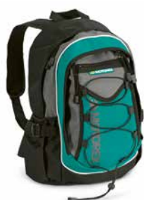
Rucksack Sac à dos Backpack