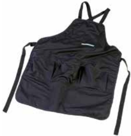
Arbeitsschürze schwarz Tablier de travail noir Work apron black Einheitsgröße | Taille unique | One size