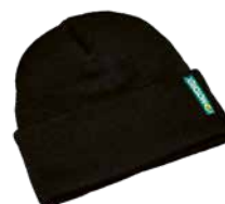
Strickmütze Bonnet Knitted hat