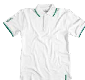
Poloshirt weiss Herren Poloshirt blanc hommes Poloshirt white men