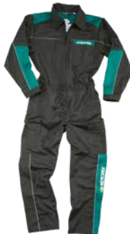
Kombi anthrazit Komfortabel und stark Combinaison anthracite Confortable et solide Overall anthracite Comfortable and strong Größen | Tailles | Sizes: 42 - 66 Größen | Tailles | Sizes: 152 + 164