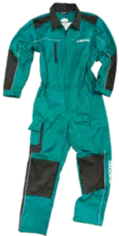
Kombi grün Komfortabel und stark Combinaison verte Confortable et solide Overall green Comfortable and strong Größen | Tailles | Sizes: 42 - 64 Größen | Tailles | Sizes: 152 + 164