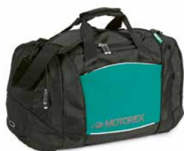
Sporttasche Sac de sport Sport bag