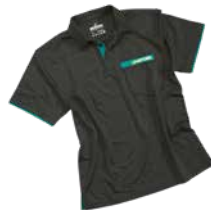
Poloshirt Work anthrazit Poloshirt Work anthracite Work polo shirt anthracite Größen | Tailles | Sizes: S-XXL