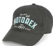
Baseball Cap Retro Casquette rétro Baseball Cap Retro