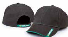
Baseball Cap grau Casquette grise Baseball Cap grey