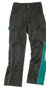
Arbeitshose anthrazit Komfortabel und stark Pantalon de travail anthracite Confortable et solide Working trousers anthracite Comfortable and strong Größen | Tailles | Sizes: 42 - 62